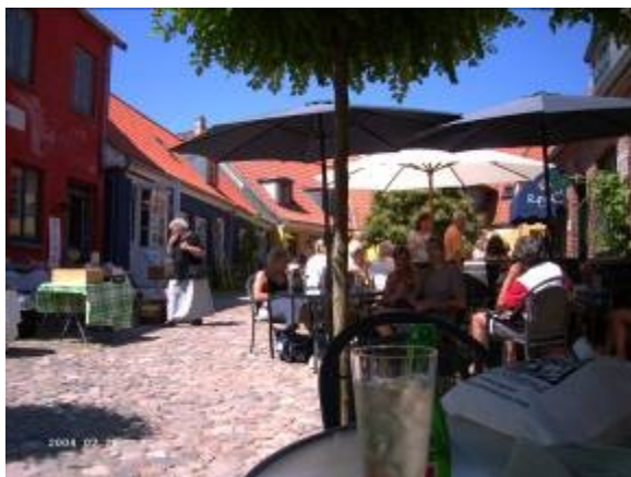
De oevers van het binnen meertje biedt een welkome verkoeling.

Deze dag besteed aan het verkennen van Stege, het is marktdag en het plaatsje is zoals we er al eerder gezien hebben. Het is snikheet, met een beetje verbeelding zitten we aan de Middellandse zee.