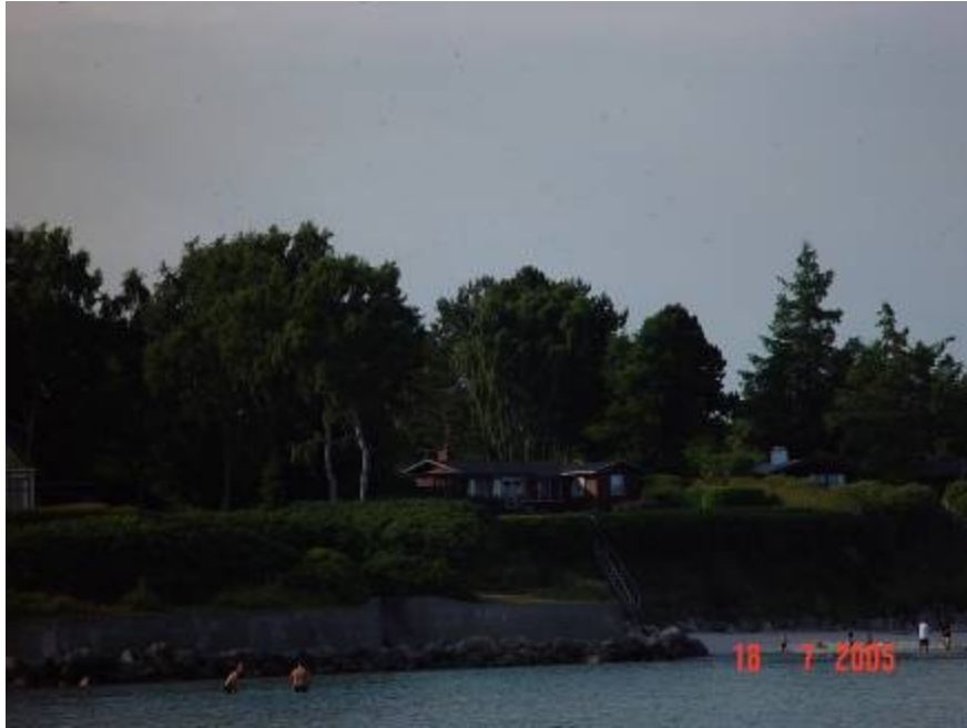
Ankerplaats bij Rodvig

Dinsdag 19-07 W 5- met uitschieters 7 een klein buitje tussendoor. Rodvig - Kopenhagen