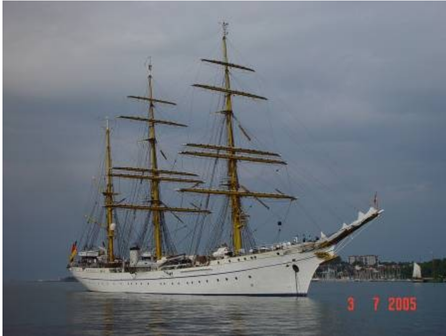
Tegenover Kiel lag de Gorch Fock voor anker , het Duitse opleidingsschip. Een rondje er omheen gevaren en toen voor anker.